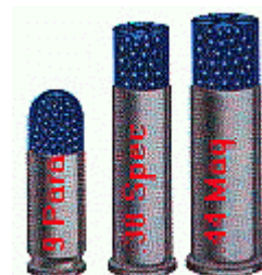
Schrotmunition für Kurzwaffen

nicht jedoch: Kleinschrotmunition z.B. für Faustfeuerwaffen