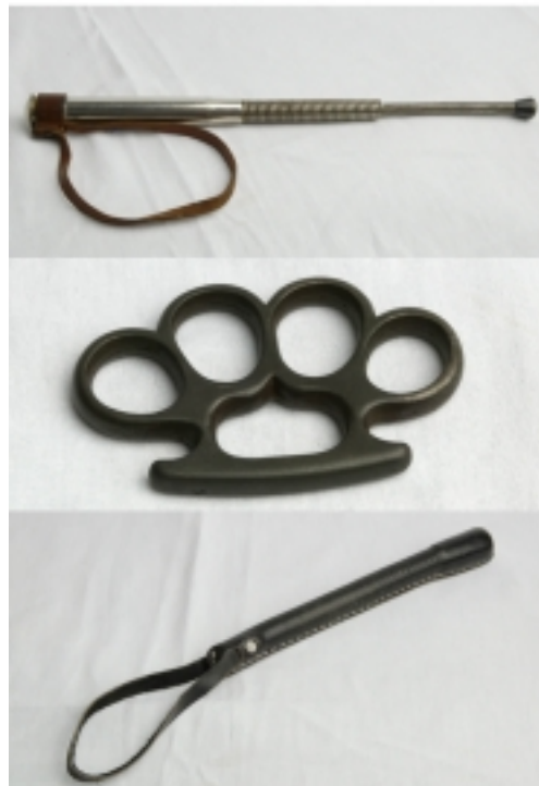
Bild: Stahlrute, Schlagring, Totschläger

Stahlruten, Totschläger oder Schlagringe; (Vergehen nach § 52/III/Nr. 1)