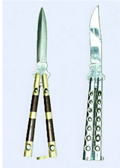
Butterflymesser

Nr. 1.4.3 Faltmesser (Butterflymesser) (Vergehen nach § 52 / III Nr. 1 WaffG)