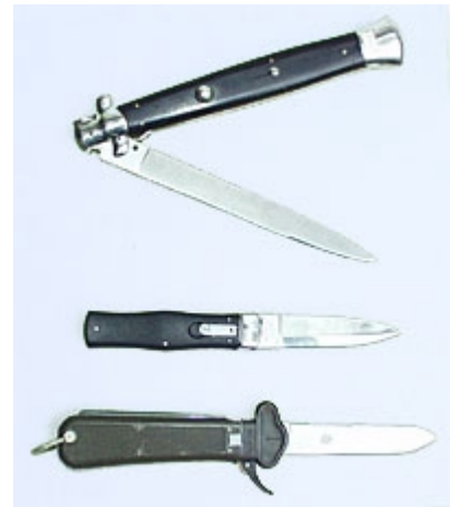
Spring- und Fallmesser

Nr. 1.4.1 wie bisher, Klingenbreite von 20% der Länge anstelle von 14 % erforderlich , Einschränkungen gelten nur für Springmesser, deren Klinge seitlich hervorschnellt. Fallmesser und Springmesser mit nach vorne austretender Klinge sind jetzt generell verboten (Vergehen nach § 52 / III Nr. 1 WaffG)