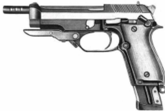
Beretta 93 R

Vollautomatische Schußwaffen , die keine Kriegswaffen im Sinne des KWKG sind, z.B. vollautomatische Pistolen wie Beretta 93 R oder Glock 18; (Verbrechen nach § 51/I WaffG)