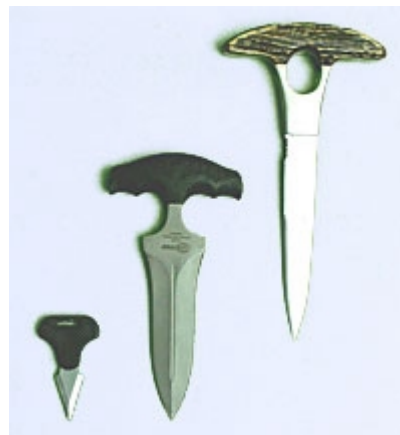
Faustmesser