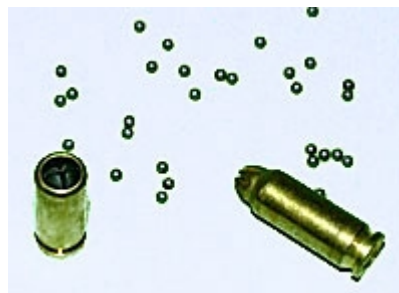
Kleinschrotmunition

Nr. 1.5.6 Kleinschrotmunition, die in Kartuschlager bis 12,5 mm geladen werden kann (Keine Sanktionsbestimmung!)